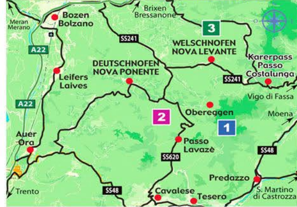
POSIZIONE GEOGRAFICA DELLE FOTO - LOCATION OF PHOTOS